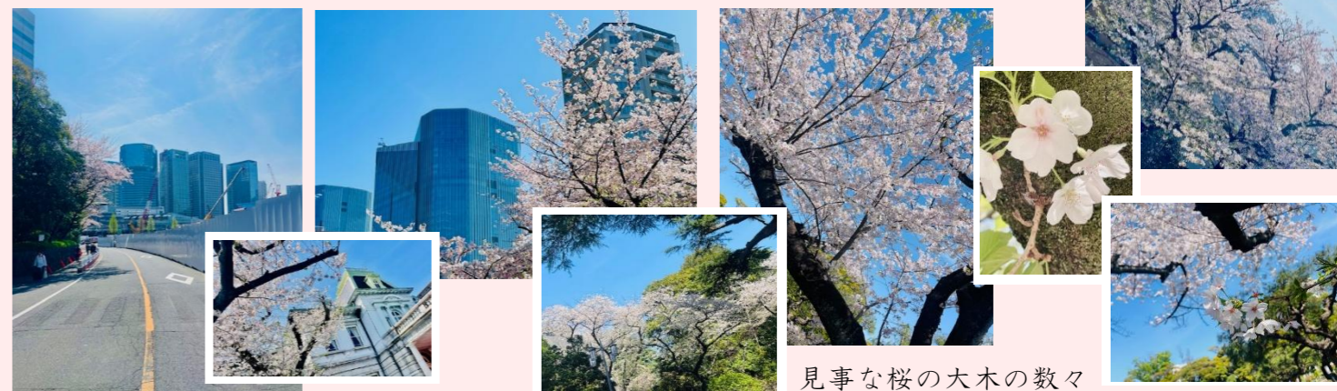
見事な桜の大木の数々

高輪公園を中心に桜坂、高輪ゲートウェイ駅周辺等に素敵に桜が咲き誇りました。 今年は高層ビルと桜の競演が楽しめました。