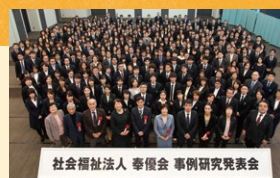
社会福祉法人 奉優会 事例研究発表会

2019年2月17日(日)、御茶ノ水ソラシティホールにて「第11回事例研究発表会」が開催され、約350名の観覧者をご来場されました。この日は、全154事例の中から本選へ進んだ14事例が発表され大変有意義な会となりました。今年度の事例研究発表会受賞作品は以下のとおりです。